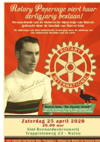
Affiche fundraising project 25 april 2020